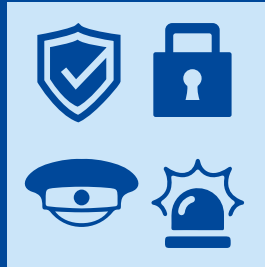
Schutz und Sicherheit